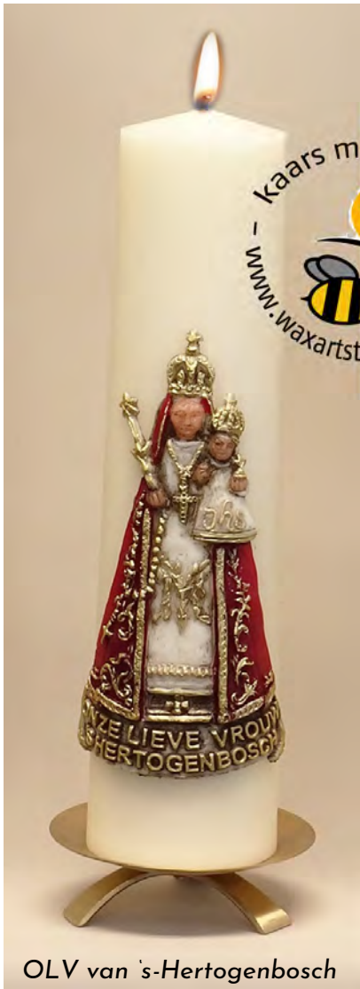
OLV van 's-Hertogenbosch