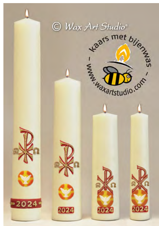
60x8 cm. 40x8 cm. 30x8 cm. 30x6 cm.