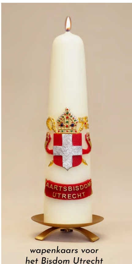
wapenkaars voor het Bisdom Utrecht