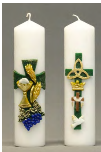
Communie en Belijdenis