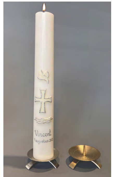
Schaalkandelaar met 3-poot in goud of zilverkleur vanaf € . 13,20/stuk.