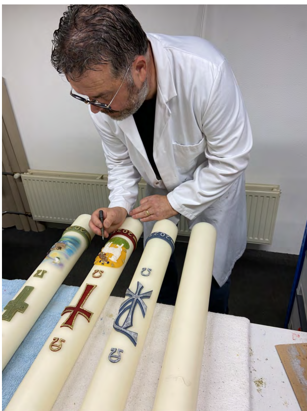
Handgemaakt met persoonlijk tintje

Voor deze extra service vragen wij geen meerprijs maar wel extra tijd, dus bestel op tijd!