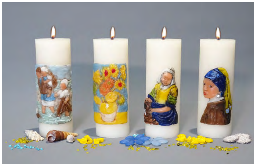
vlnr. Kinderen der Zee (J. Israëls), de Zonnebloemen (v. Gogh), het Melkmeisje en Meisje met de Parel (J. Vermeer)

Vanaf € 15,00 per stuk. Ook in set leverbaar.