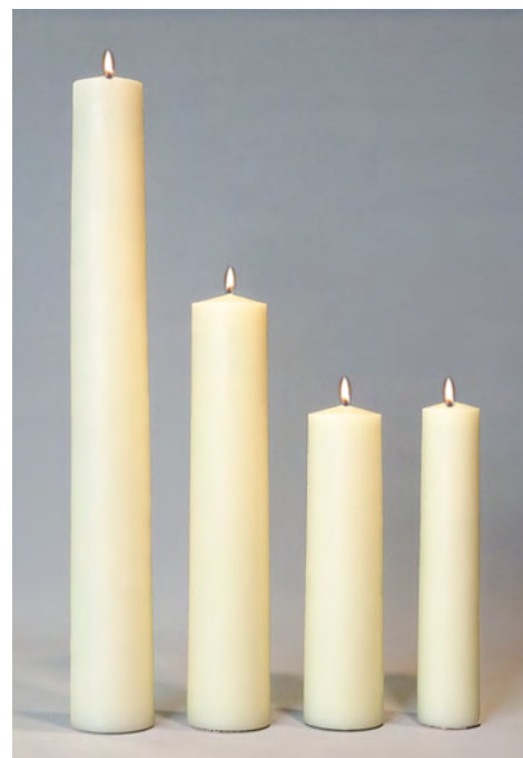
60x8 cm. 40x8 cm. 30x8 cm. 30x6 cm.