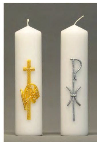
Herdenking en Allerzielen