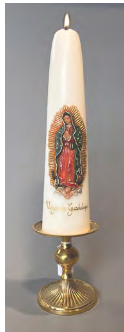
Schaalkandelaar hoog model goudkleur . € . 26,65/stuk.

We hebben een beperkte voorraad kandelaars voor de grotere Paaskaarsen.